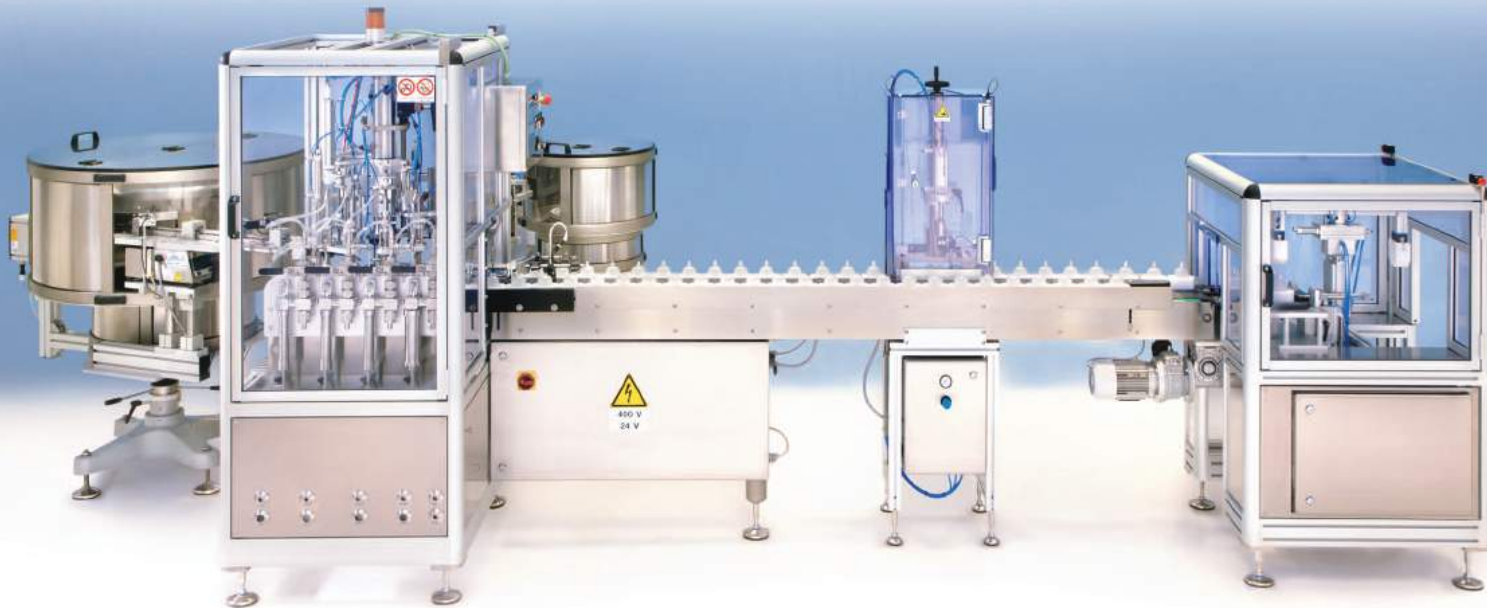
Standard set up

FILLING – CRIMPING AUTOMATIC LINE LIGNE AUTOMATIQUE DE CONDITIONNEMENT LÍNEA AUTOMÁTICA DE EMBALAJE